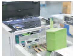
封入封緘検査装置