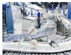
オフセット輪転機