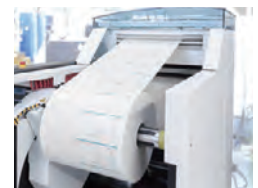
高速バリエブル印刷機