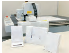
サンプルカッター