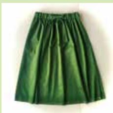
■ メルチデザイン 尾州デニムスカート等