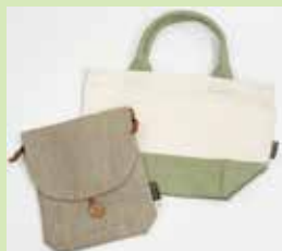
■ (株)艶金 「のこり染」 トートバッグ&ご朱印帳入れ等