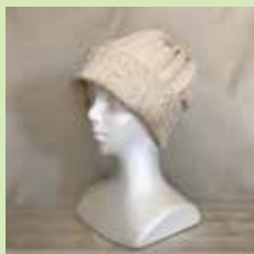
■ Team Apop 和綿のアポビキャップ等