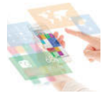
●デジタルコミュニケーション